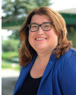
مع أطيّب التحيات

الهدف من العروض المذكورة هنا هو تعزيز التعامل مع الفرص والتحديات. إنها تركز - من بين أمور أخرى - على تدريس المعرفة التربوية (على سبيل المثال على الاحتياجات المتعلقة بالطفل في مراحل النمو والتطور المختلفة أو التربية الخالية من العنف)، وعلى معلومات حول مواضيع قانونية (مثل إجازة الأبوة، وحق حضانة الأطفال) أو المسائل التنظيمية (مثل إمكانية التوفيق بين الوظيفة والأسرة). المؤسسات المذكورة هنا معروفة وستساعدكم في بحثكم عن العرض المرغوب.